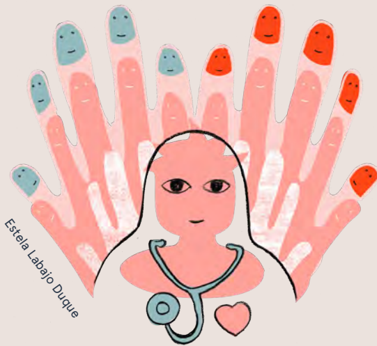
Estela Labejo Duque